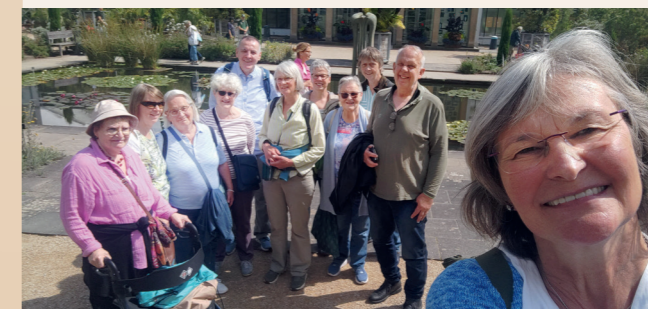
Das Ladenkirchenteam freut sich über Verstärkung.

WIR sind eine starke Gemeinschaft, in der jede*r ein Stück Verantwortung trägt. WIR wollen (er) leben, was trägt. Freiwillige in der Evangelischen Ladenkirche sorgen für den Wandel, den sich viele wünschen. Mit Liebe gekochtes Essen, mit Freuden vorbereitete Angebote mit Anderen für Alle zum Mitmachen. Wie wird man Teil des Teams? EINFACH kommen und dabei sein.