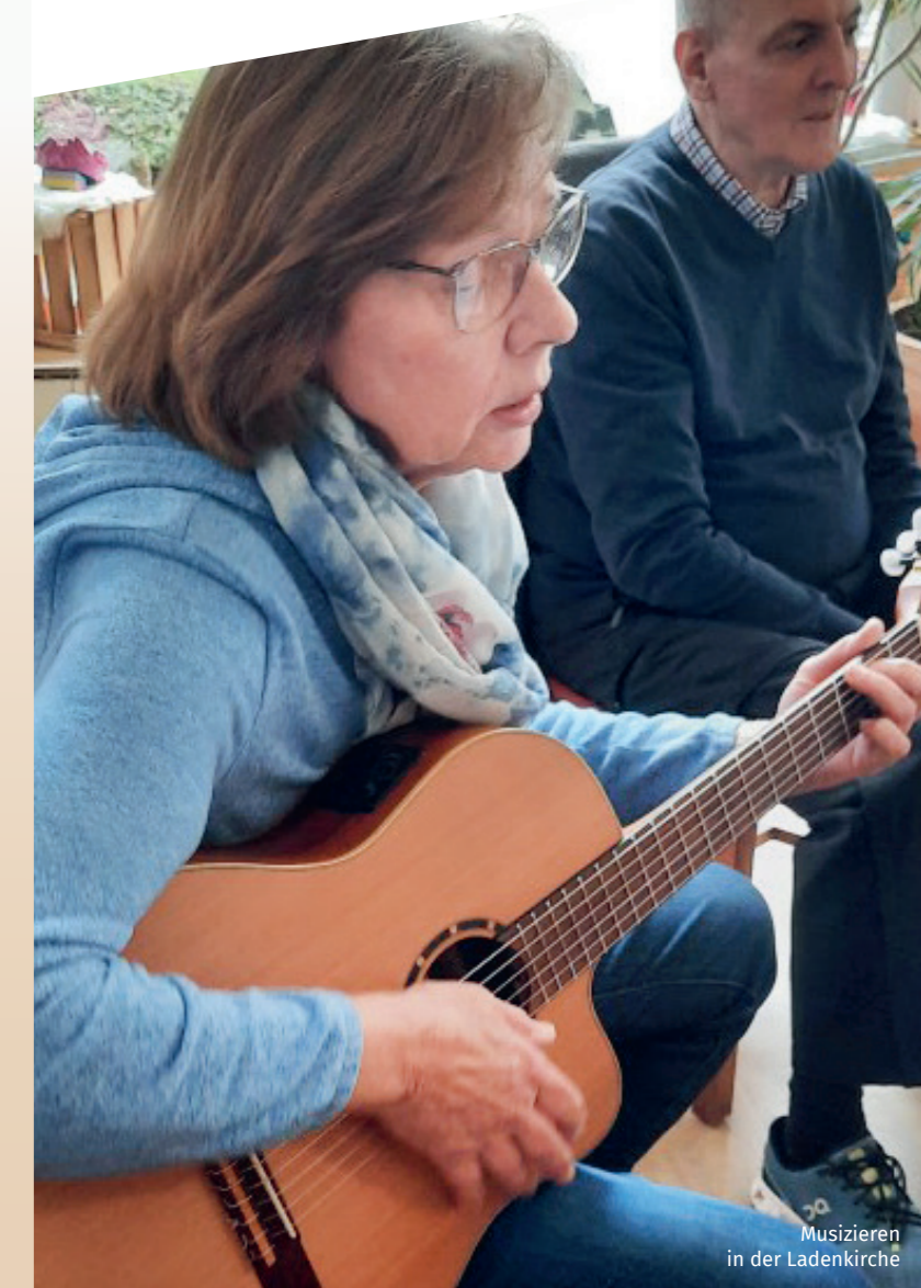
Musizieren in der Ladenkirche