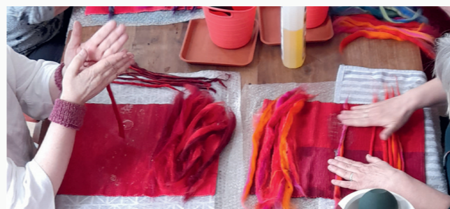
Filzen in der Ladenkirche

Offener Treff für begeistert Strickende, Häkelnde oder anderweitig Bastelnde, begleitet durch das Ladenkirchenteam. Materialien bringt jede*r selber mit. Bitte auf Sondertermine achten.