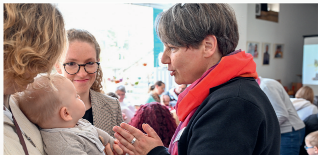
Ökumenische Segensfeier in der Ladenkirche