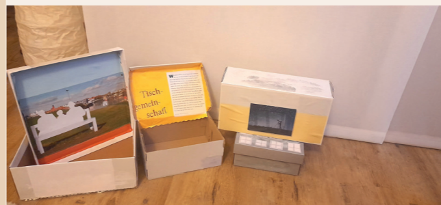
Produkte aus der Kreativwerkstatt - Traumwohnungselbst gebaut.

Termine: 14. Januar / 11. Februar / 11. März / 8. April / 10. Juni -> Bitte um ANMELDUNG