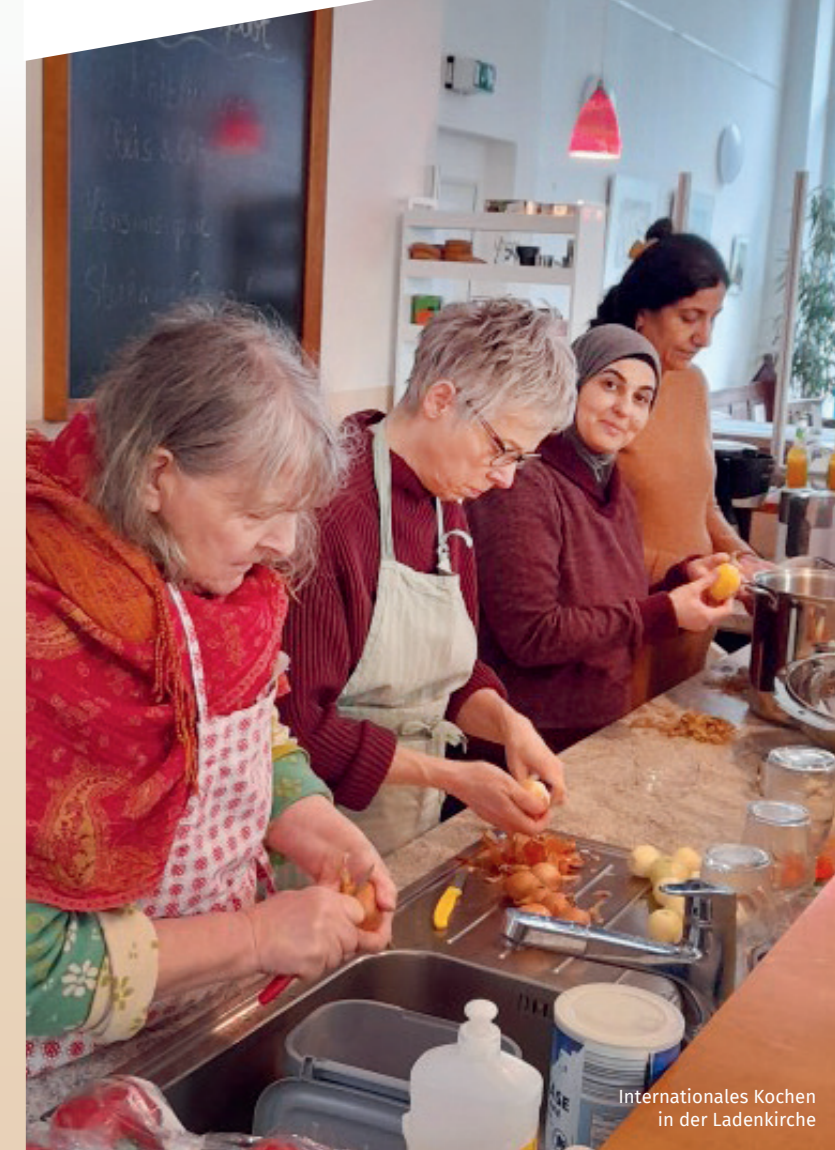
Internationales Kochen in der Ladenkirche

WIR wollen (er) leben, was trägt. Freiwillige in der Evangelischen Ladenkirche sorgen für den Wandel, den sich viele wünschen. Mit Liebe gekochtes Essen, mit Freuden vorbereitete Angebote mit Anderen für Alle zum Mitmachen. Wie wird man Teil des Teams? EINFACH kommen und dabei sein.